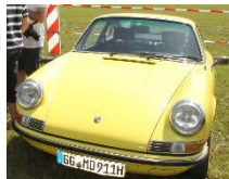
Porsche 911 T